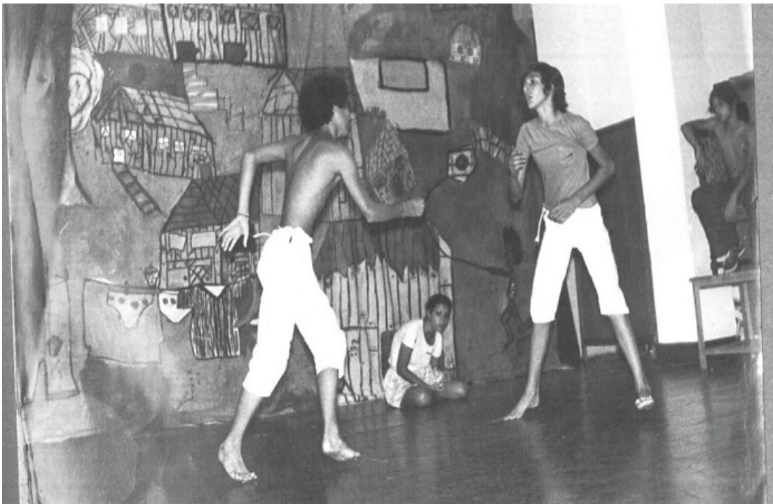
figure 14 : Capoeira