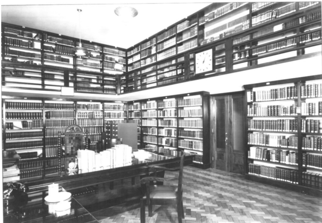
figure 6 : la bibliothèque