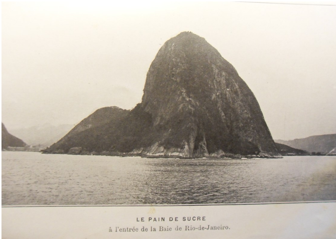
figure 15 : le Pain de Sucre - la plage du Flamengo (CDM) La carte postale écrite en français suggère la force de la langue française au Brésil à cette époque. Ce paysage est une référence pour les français à Rio, jusqu'à aujourd'hui.