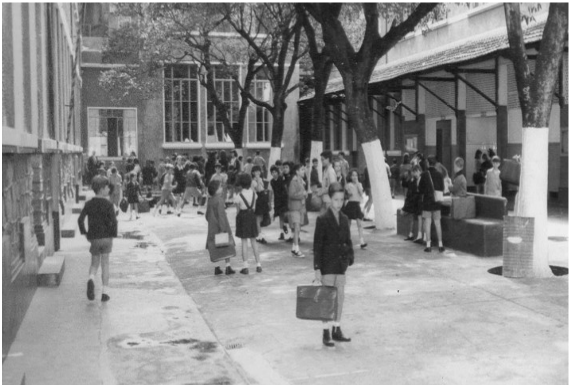
figure 12 : la récréation – Cour des arbres/patio das árvores (CDM)