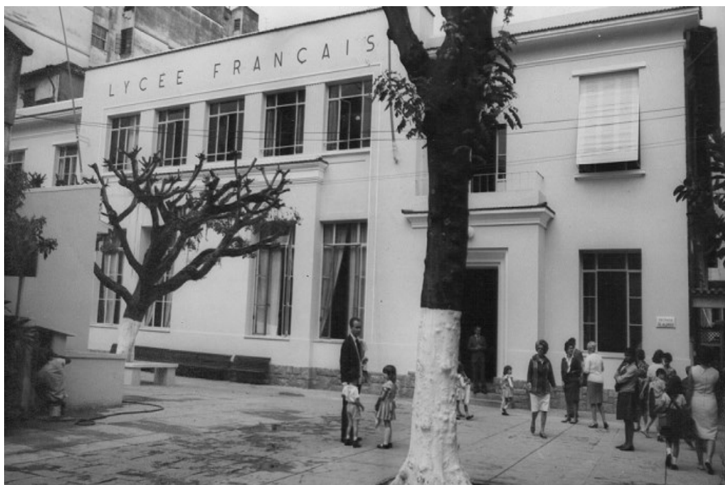
figure 7 : la rentrée des élèves (CDM)