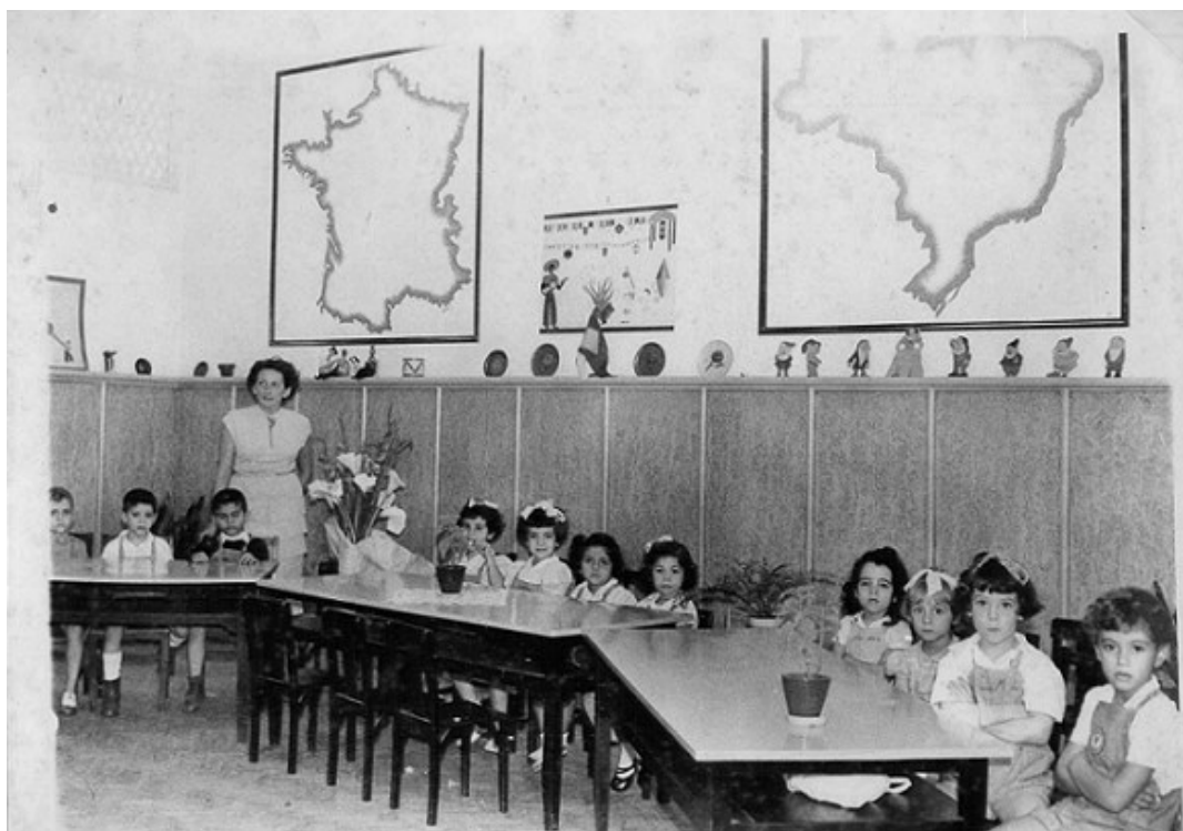
figure 9 : classe de maternelle