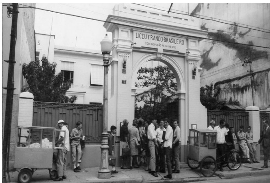
figure 8 : la façade du Lycée -années 1950-1960