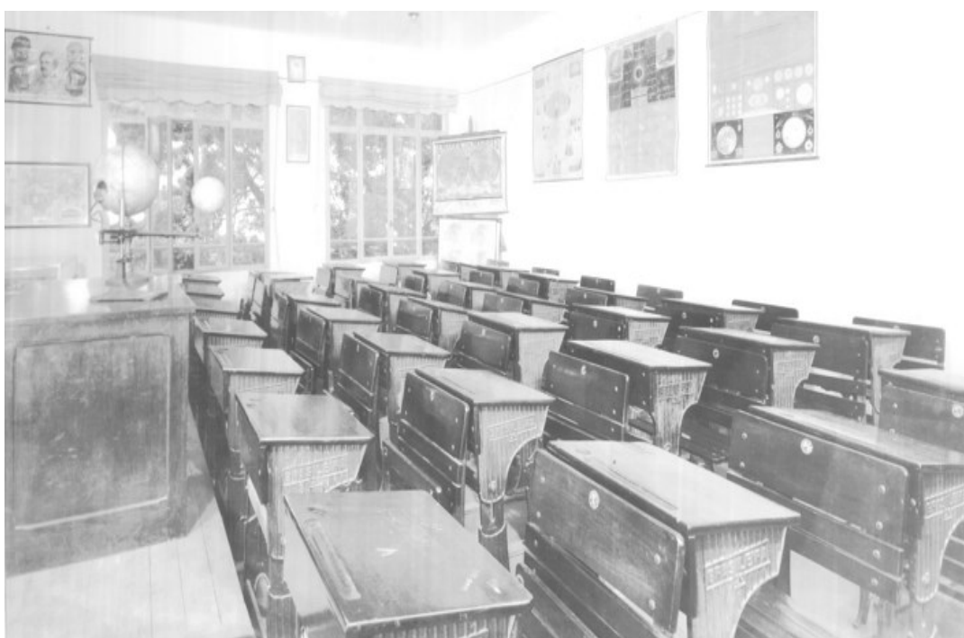
figure 10 : salle de geographie