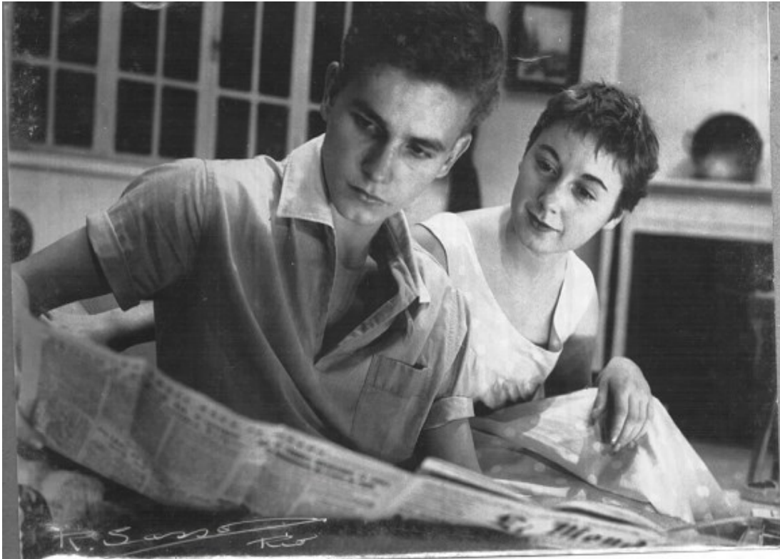
figure 13 : théâtre au Lycée