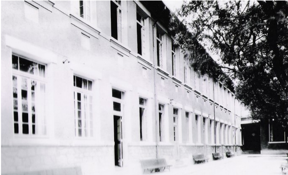
figure 11 : la récréation