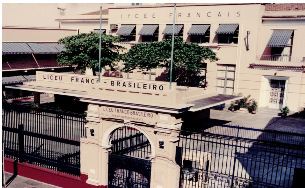
figure 2 : La façade du Lycée (CDM)